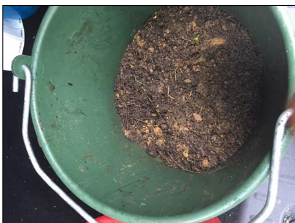
Bild 2: Hinken visar jord med 20 stycken stickprov som blandas till samlingsprovet.