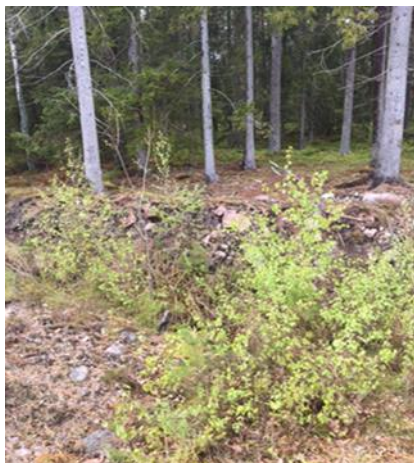
Bild 4: Bilden visar en av dem två områden där referensprov togs.