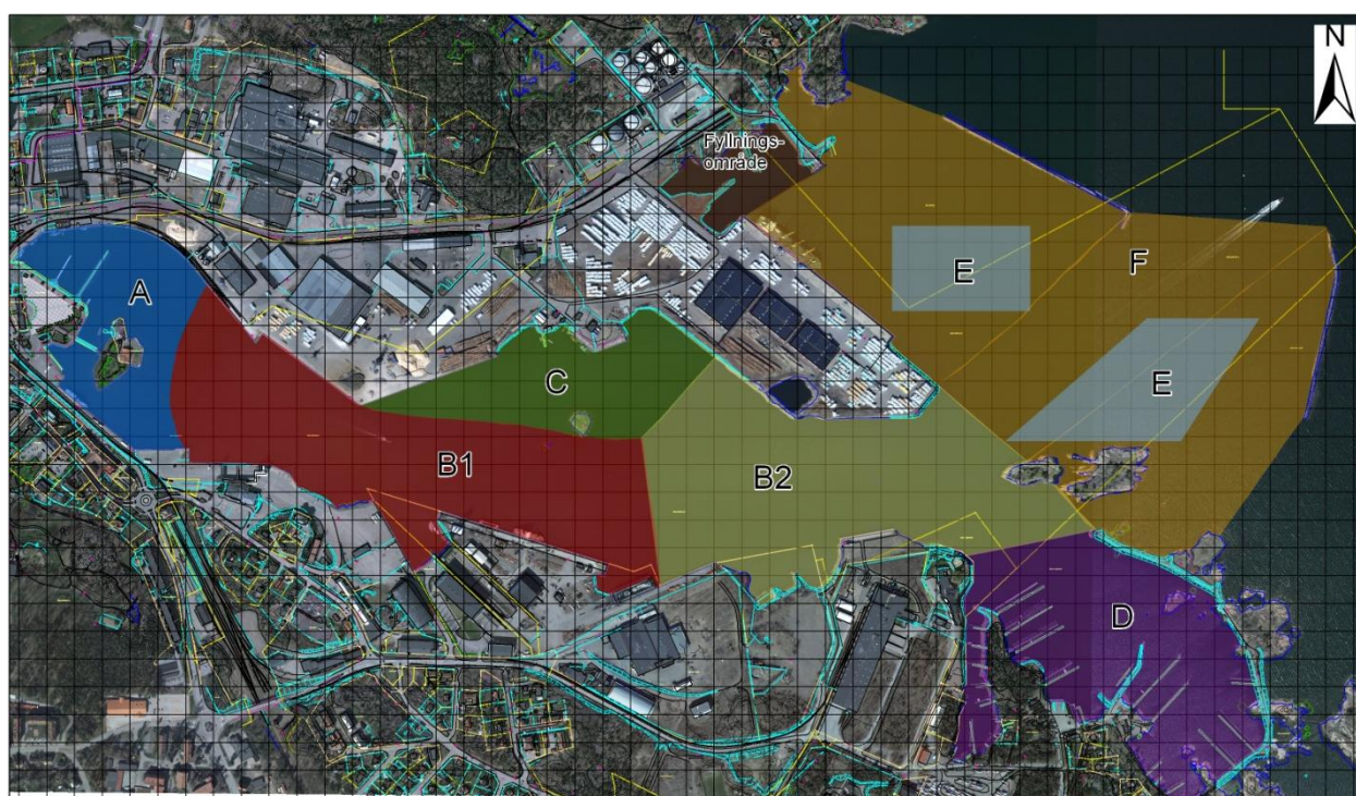
Figur 1. Indelning av hamnbassängen i sju delområden

En stor mängd sedimentprover har uttagits från Oskarshamns hamnbassäng. Med underlag av resultaten av dessa samt framtida användning av hamnen har hamnen delats in i 7 delområden, se figur 1 . Baserat på analysresultaten från provtagningarna har aritmetiska föroreningshalter i sedimenten för respektive delområde beräknats för 11 ämnen (As, Cd, Cu, Fe, Hg, Pb, Zn, Ni, dioxiner, PCB och TBT). Utifrån medelvärdena beräknas därefter de teoretiska totalhalterna i ytvattnet vid muddring som funktion av halten suspenderande ämnen i vattnet vid respektive delområde, se figur 2 för exempel.