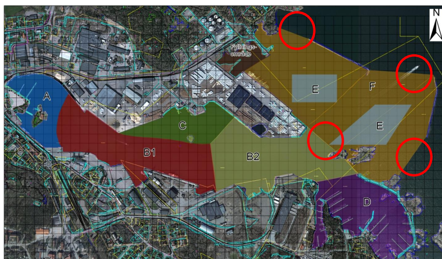
Figur 4 Inre och yttre hamnens utlopp.

Vid inre hamnens utlopp (se figur 4 ) (eller vid yttre hamnens utlopp vid muddring i yttre hamnen) föreslås halten suspenderande ämnen under åtgärdsfasen som årsmedelvärde inte få överstiga 20 mg/l (ca 2,5 ggr beräknad årsmedelhalt av susp i nuläget). Maximalt får halten suspenderande ämnen inte överstiga 100 mg/l. Med hänsyn till att akuta effekter inte får uppkomma föreslås att det maximala riktvärdet inte får överstigas mer än 24 h i sträck.